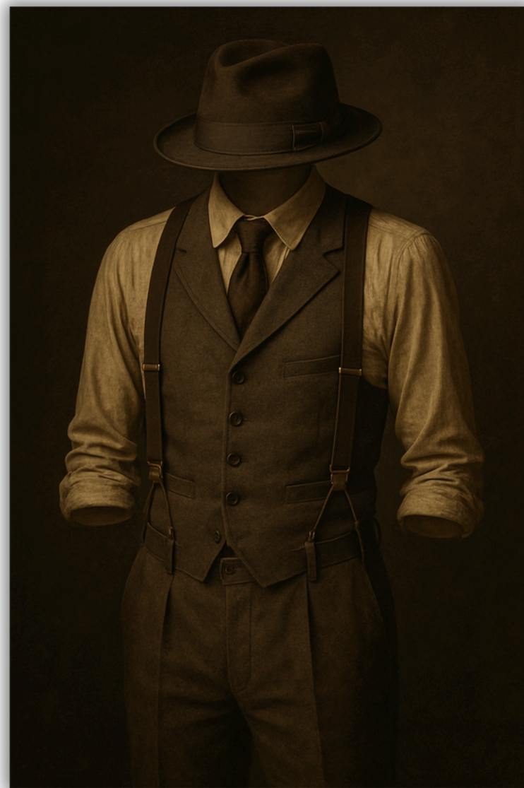
Idée costume prohibition aux USA début XXème siècle

Il incarne l'esthétique de l'époque : élégance sobre, matières brutes, gilet croisé, bretelles et chapeau.